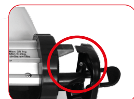
Letture corretta del peso indicatore e contro-indicatore allineati