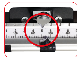
Asta serigrafata ben leggibile