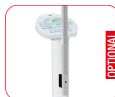
Versione con Statimetro posizionato centralmente