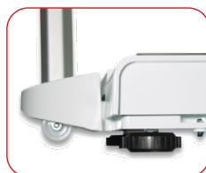
Wheels for an easy transport - Adjustable feet