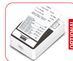
Stampante termica per Peso e BMI