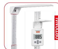
Statimetro telescopico manuale: Lettura digitale o serigrafata