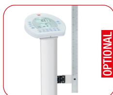
Versione con Statimetro posizionato lateralmente