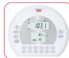
Visore a tripla lettura Peso Altezza BMI