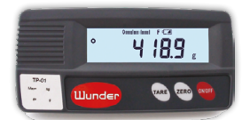
VISORE REMOTO OPTIONAL