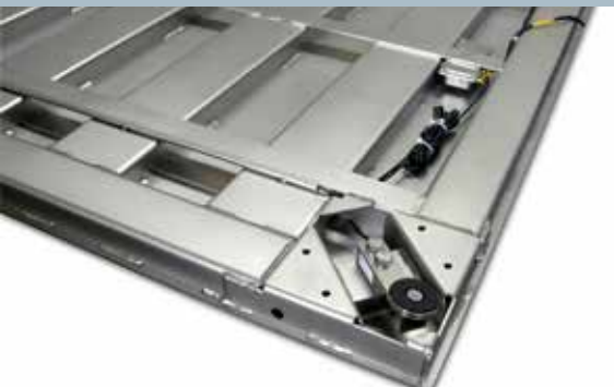
Alloggiamento cella di carico (particolare)