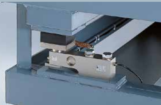
Particolare cella di carico con elastòmero anti-shock Detail of load cell with elastomer system

ROBUSTA STRUTTURA costruita in PROFILATI METALLICI ricoperti con lamiera liscia DI FORTE SPESSORE